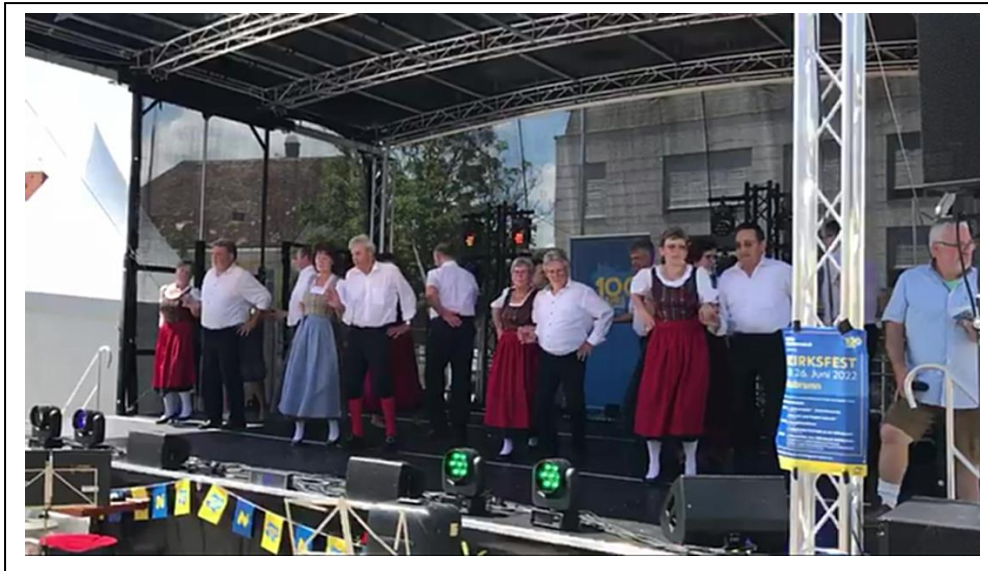
1. Auftritt 2022> 100 Jahre NÖ. In Hollabrunn mit der VTG-Hollabrunn