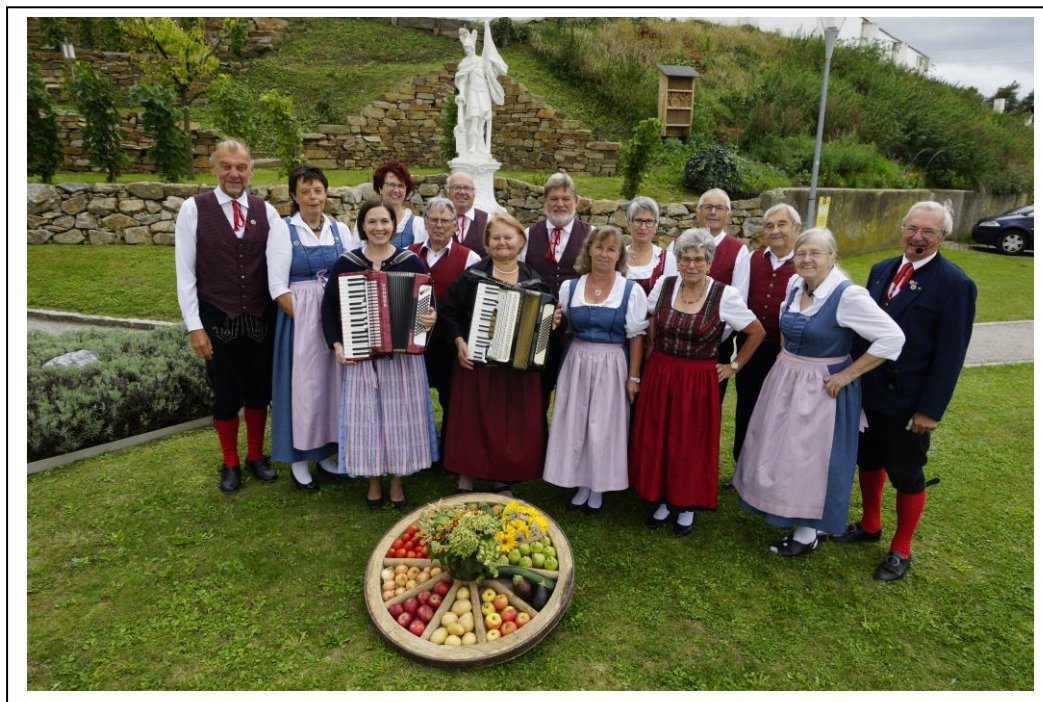
VTG-Schmidatal u. SVTG-Wagramland beim Erntedankfest am 11.09.2022 in Glaubendorf