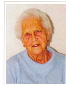
Gute Mutter, tausend Dank am Grabe, für alle Deine Mühe, Sorg' und Plage, nun ruhen die fleißigen Mutterhände, die tätig waren bis ans Ende.